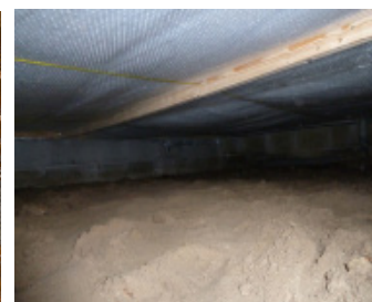
Iso booster Vloerisolatie

Het isoleren van een houten vloer met Neopixels vloerisolatie